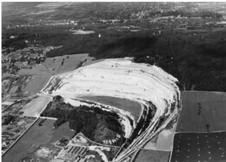
► Depuis près de deux siècles, la carrière de Corneilles s'inscrit dans le paysage. Cette vue aérienne la montre en 1954. Entre la ville et la carrière existe une zone de seuil qui participe au contraste territorial.

antérieur du territoire. Cette puissance d'évocation les rend grandioses. «Présence par l'absence», c'est ainsi que le philosophe Emmanuel Levinas définit le concept de trace. L'érosion est à l'origine de ce paysage d'exception en Île-de-France, même si cette origine est plus industrielle que naturelle.