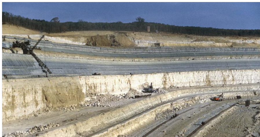
► La carrière de Cormeilles, au plus fort de son extension au début des années 1960, est exploitée par gradins selon les différentes couches géologiques.

Pendant trois quarts de siècle, des générations ne vont cesser de s'émerveiller devant « la plus grande carrière d'Europe » et les 100 mètres de hauteur de ses différents niveaux. Quant à ceux qui, trop éloignés, n'ont pu venir jusque dans le Val-d'Oise, ils gardent en mémoire la photographie, en noir et blanc puis en couleur, du célèbre front de taille figurant en bonne place dans leur manuel de 4 e .