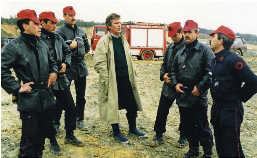
► Alain Delon entouré des pompiers de Cormeilles sur le tournage de Ne réveillez pas un flic qui dort en septembre 1988.

LE XX e SIÈCLE EST LE TEMPS DE L'IMAGE ANIMÉE. LA CARRIÈRE DE CORMEILLES OFFRE SON DÉCOR AU CINÉMA OU À LA VIDÉO POUR DES FILMS PÉDAGOGIQUES, PROFESSIONNELS OU DE FICTION.