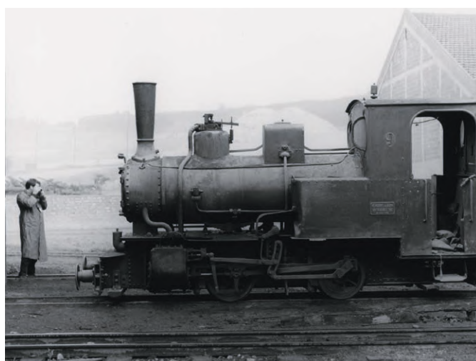
► En novembre 1967, un membre britannique de la très renommée « Industrial Railway Society » immortalise la locomotive n° 9 (type 60PS de construction Henschel & Sohn n° 23017 de 1936).