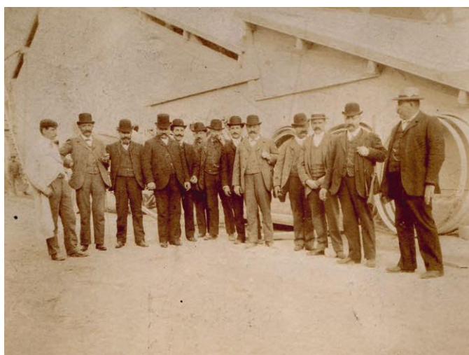
► Des professionnels du bâtiment visitent l'usine de Cormeilles le 28 septembre 1904.

PROFESSIONNELS DU BÂTIMENT ET DES MATÉRIELS DE CONSTRUCTION, ÉLUS LOCAUX, PASSIONNÉS DE MATÉRIEL FERROVIAIRE OU GRAND PUBLIC SONT AUSSI DES VISITEURS DE LA CARRIÈRE.