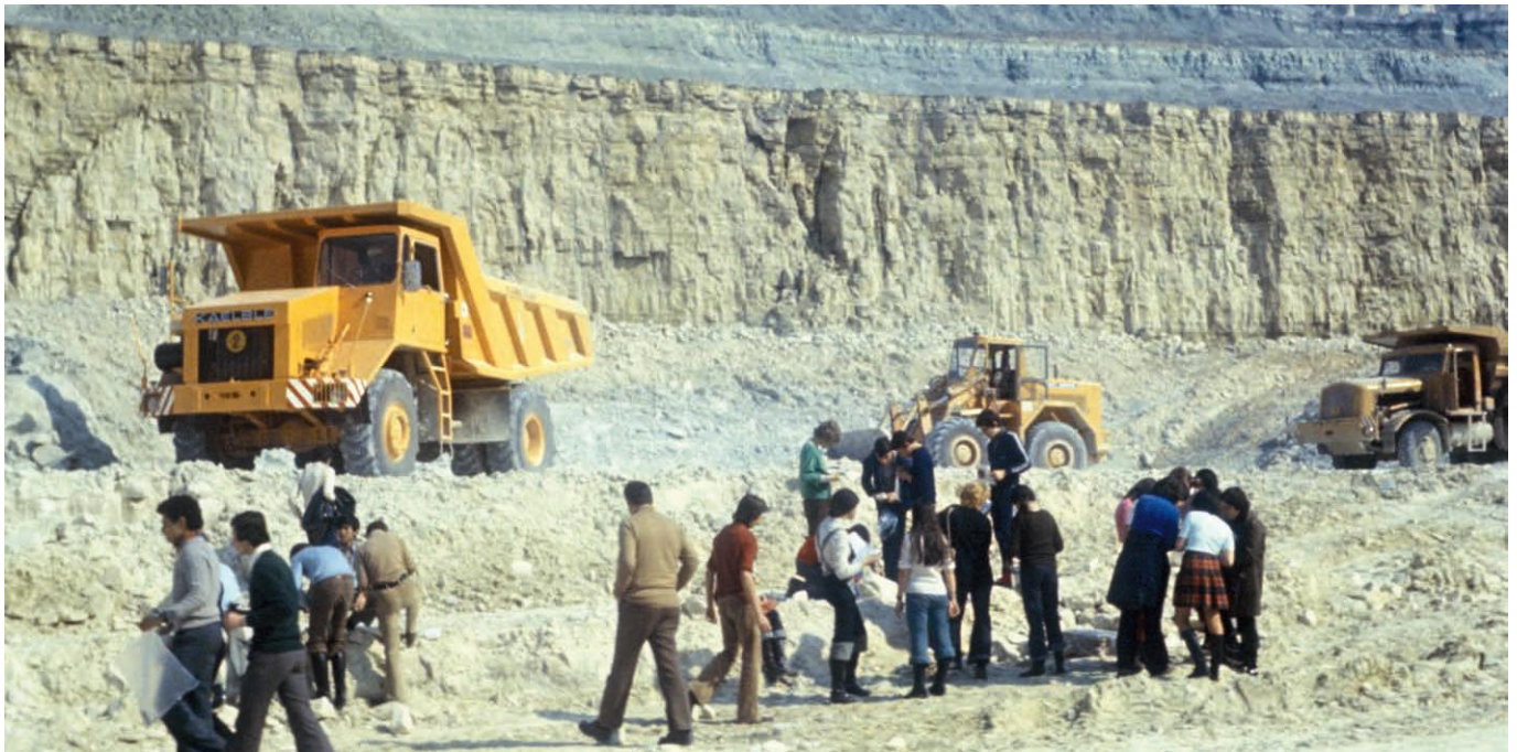
► Etudiants ou lycéens échantillonnant dans la couche de gypse le 22 mars 1973. Les engins de carrière restent en activité dont un tombereau de marque Kaelble.