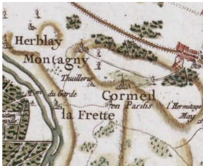
Extrait de la carte de France de Cassini, 1756.