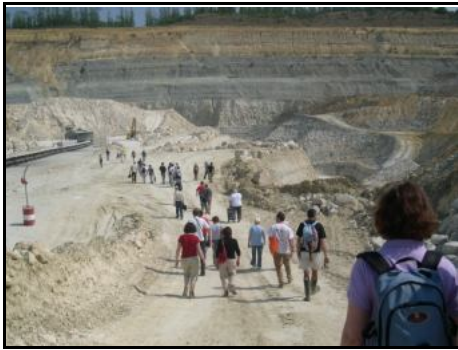
FÊTE DE LA SCIENCE 13 octobre 2007