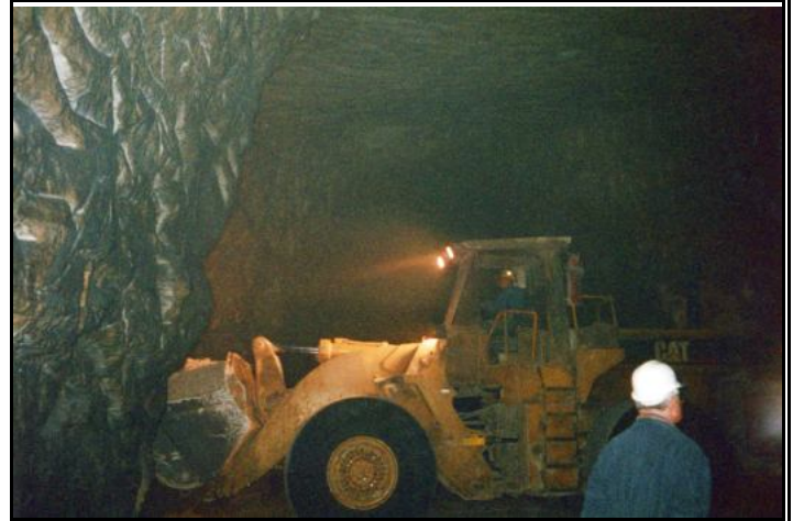
Carrière de la Forêt de Montmorency.

les industriels ont pris en compte la qualité écologique des milieux concernés pour les reconstituer, la stabilisation des terrains en cours et en fin d'exploitation, la minimisation des impacts sur les eaux superficielles et souterraines ainsi que l'insertion paysagère de la carrière.