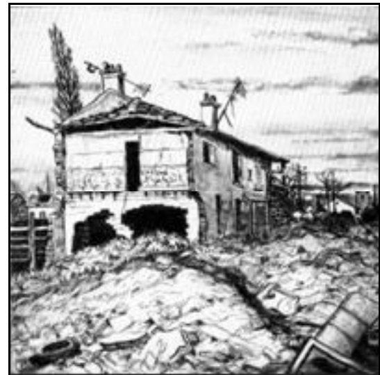
La maison détruite, 1995. Eau-forte, aquarelle, pointe sèche et toulette sur laiton, 246x247. Tirage de l'artiste. Coll. Musée du Plâtre.