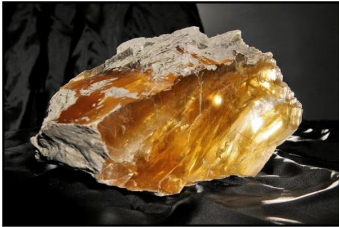
Cristal de gypse.