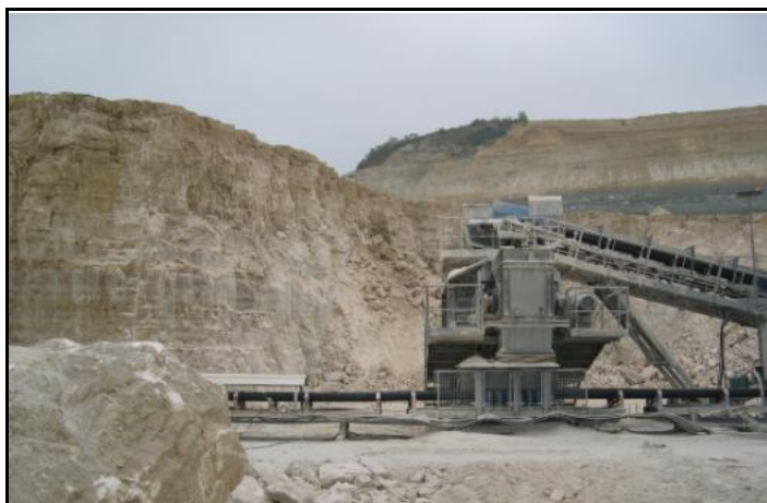
Carrière à ciel ouvert de Corneilles-en-Parisis.

Une exploitation correctement conduite permet de récupérer la totalité du gypse des trois premières masses. Dans les grandes carrières comme celles de la région parisienne, l'exploitation et la réhabilitation peuvent se faire parallèlement en continu.