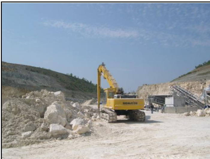
Carrière de Cormeilles.

D'autre part l'exploitation va générer des nuisances : bruit, vibrations, poussières, pollutions par les gaz de combustion, l'apparition d'une circulation d'engins et de camions. C'est-à-dire une circulation interne axée sur l'extraction et l'acheminement du gypse vers l'usine. Et une circulation externe concernant le transport des produits finis vers les lieux de stockage ou d'utilisation, mais aussi le transport de matières inertes provenant de l'extérieur pour combler les parties exploitées et reconstituer le relief initial du site.