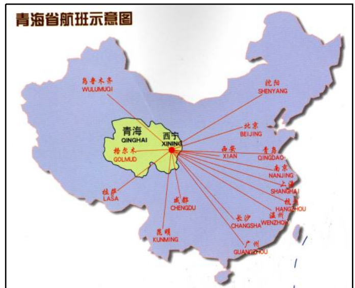
La Province du Qinghai au cœur de la Chine.